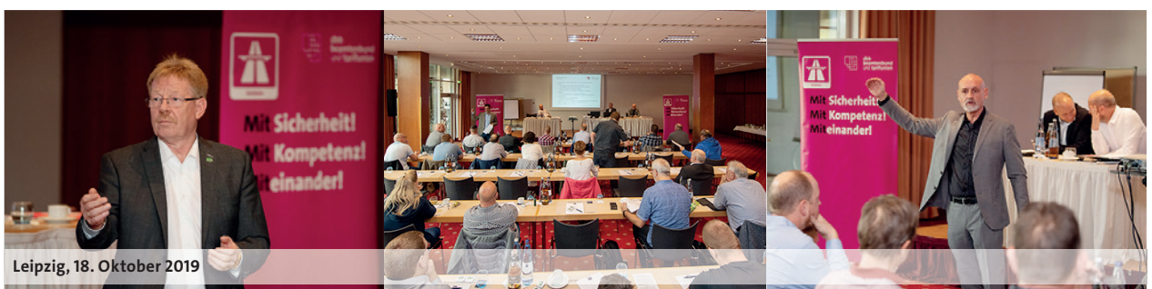
Leipzig, 18. Oktober 2019